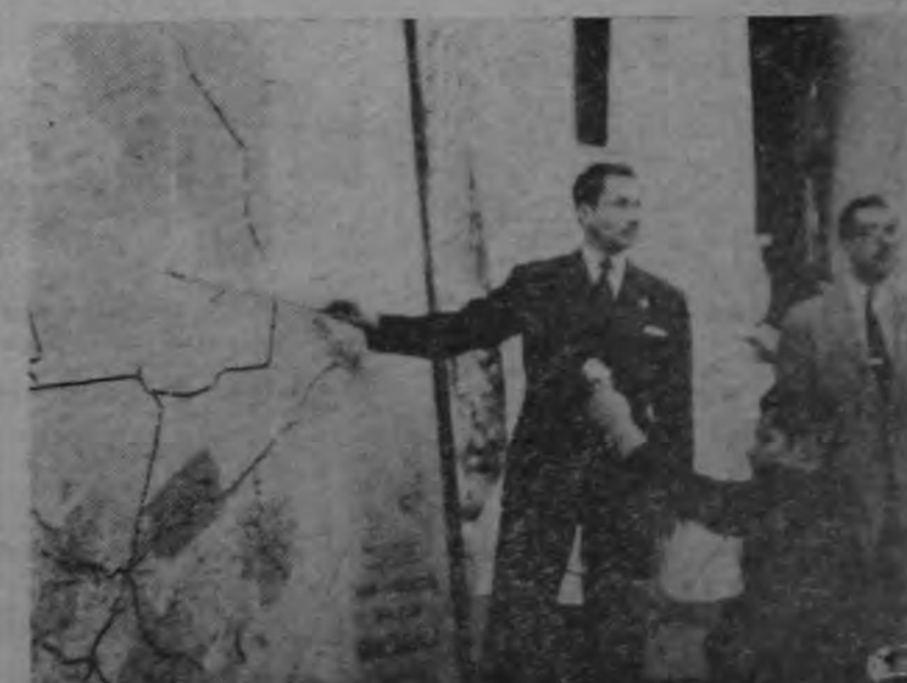
PRESIDENTE DA CONFERENCIA DE PRENSA.— El Coronel Carlos Castillo Armas, Presidente de Guatemala, en una conferencia de Prensa dada con motivo de reciente reunión de ODECA.