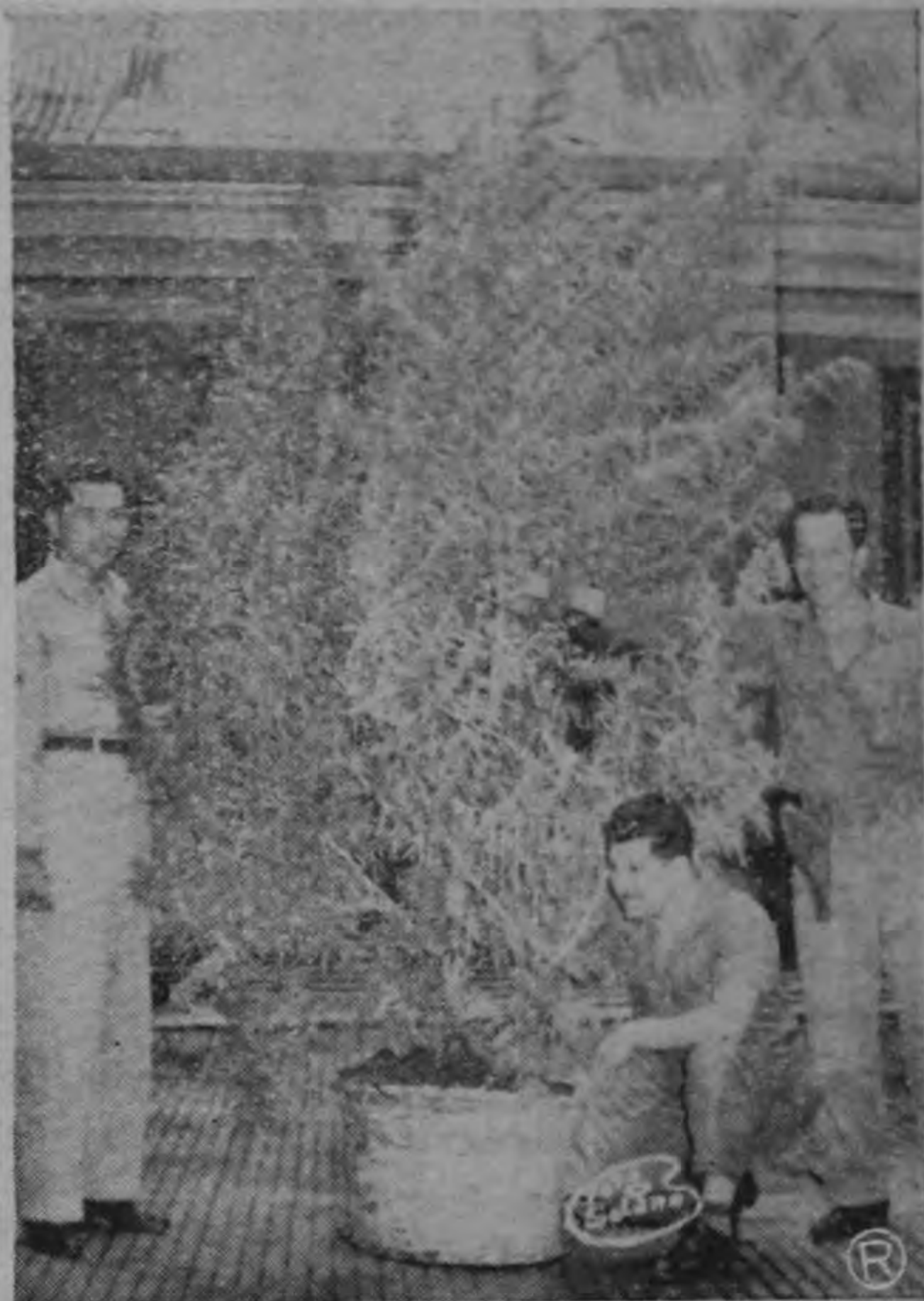
MARIHUANA.— La gráfica de Solano muestra una de las matas de marihuana que el Resguardo de Puerto Viejo encontró en una plantación de veinte manzanas. Cada mata tiene dos metros.

Jefe del Servicio Meteorológico Ministerio de Agricultura e Industrias