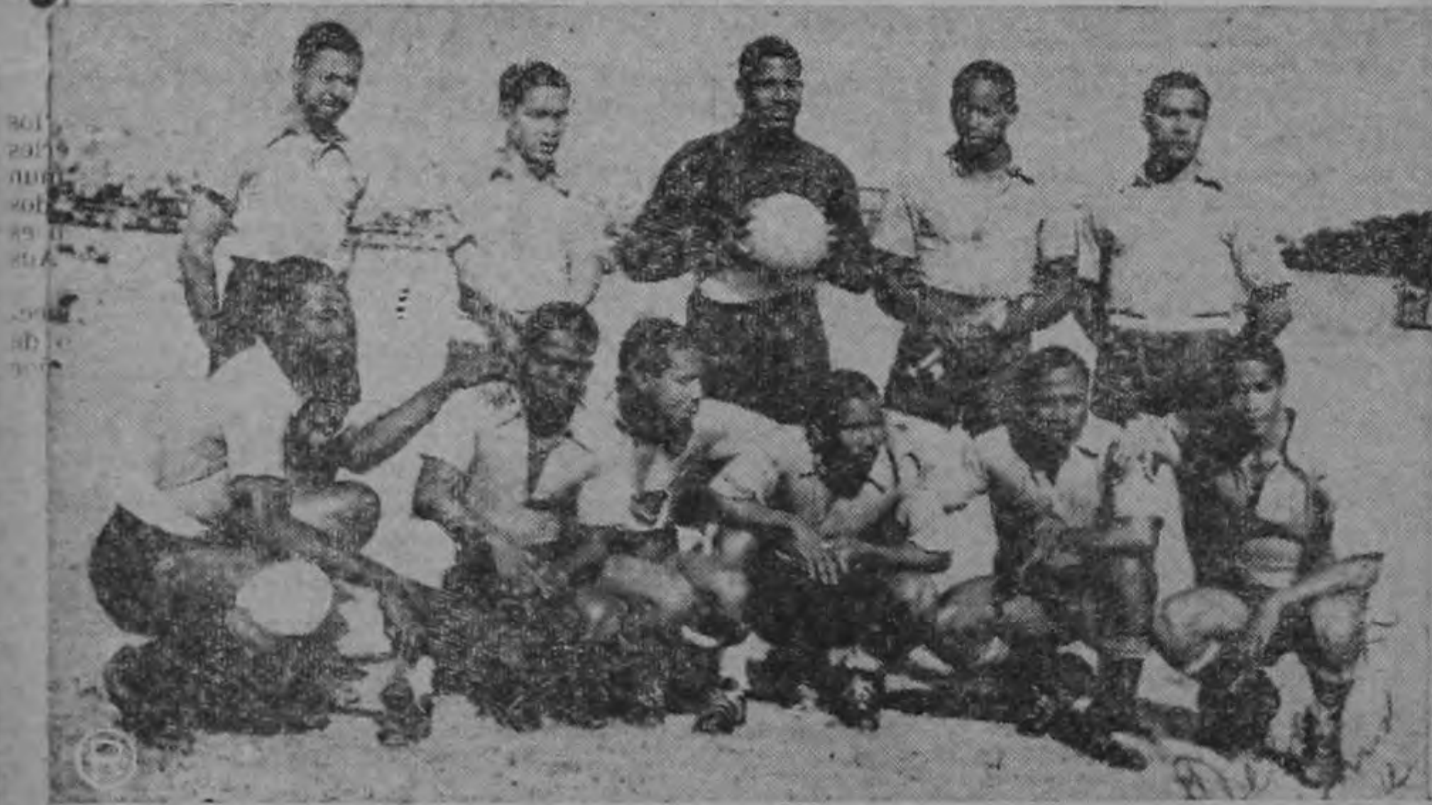
CURAZAO. — que si mañana vence a CUBA hace los ocho puntos