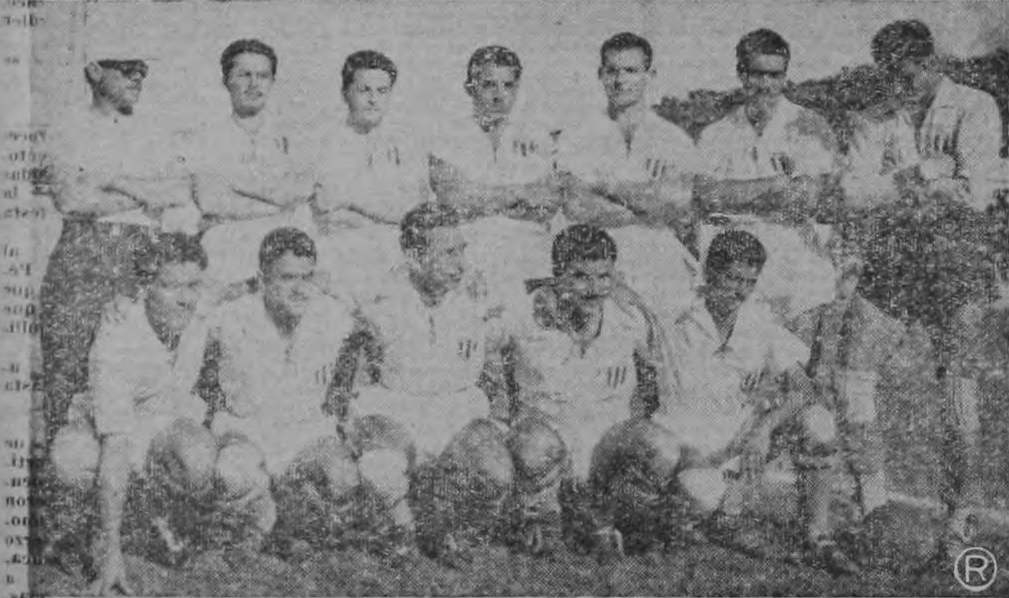
COSTA RICA. — Es este el elenco que ya había logrado la puntuación máxima, los diez puntos, pero al que se obliga a volver atrás y ganar mañana a Honduras.