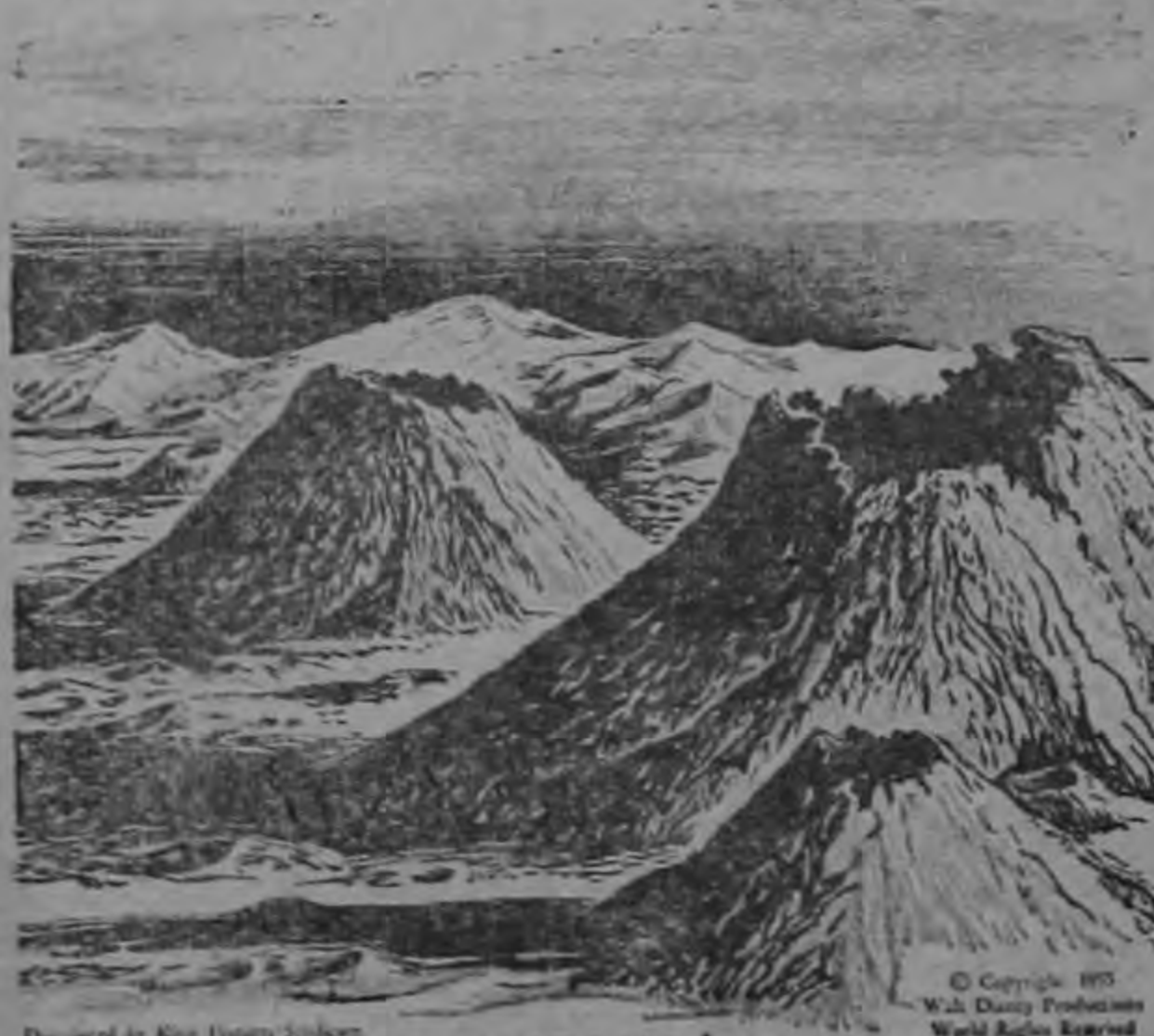
... EN IDAHO! ("CRATERES DE LA LUNA", MONUMENTO NACIONAL)