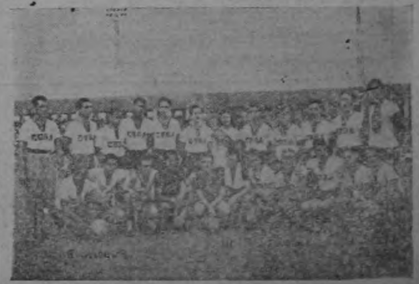
CUBA. — Que puede ofrecer "algo" y quizá brindar un empate glorioso para su Patria