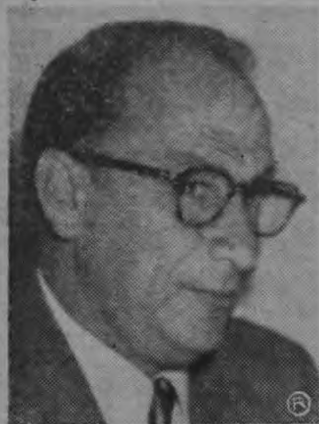
MINISTRO ORLICH ...planteó negociación...