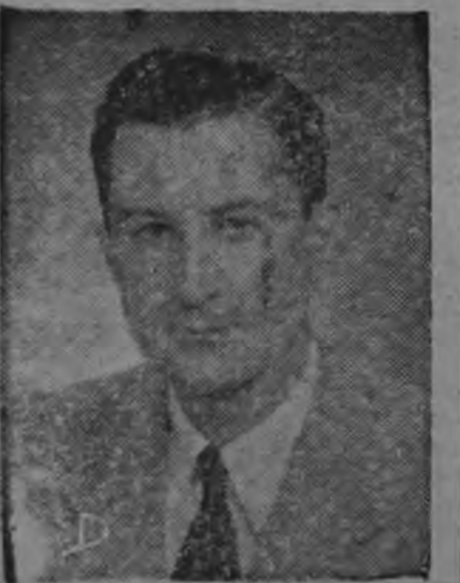
MINISTRO ROSSI ...fue informado...