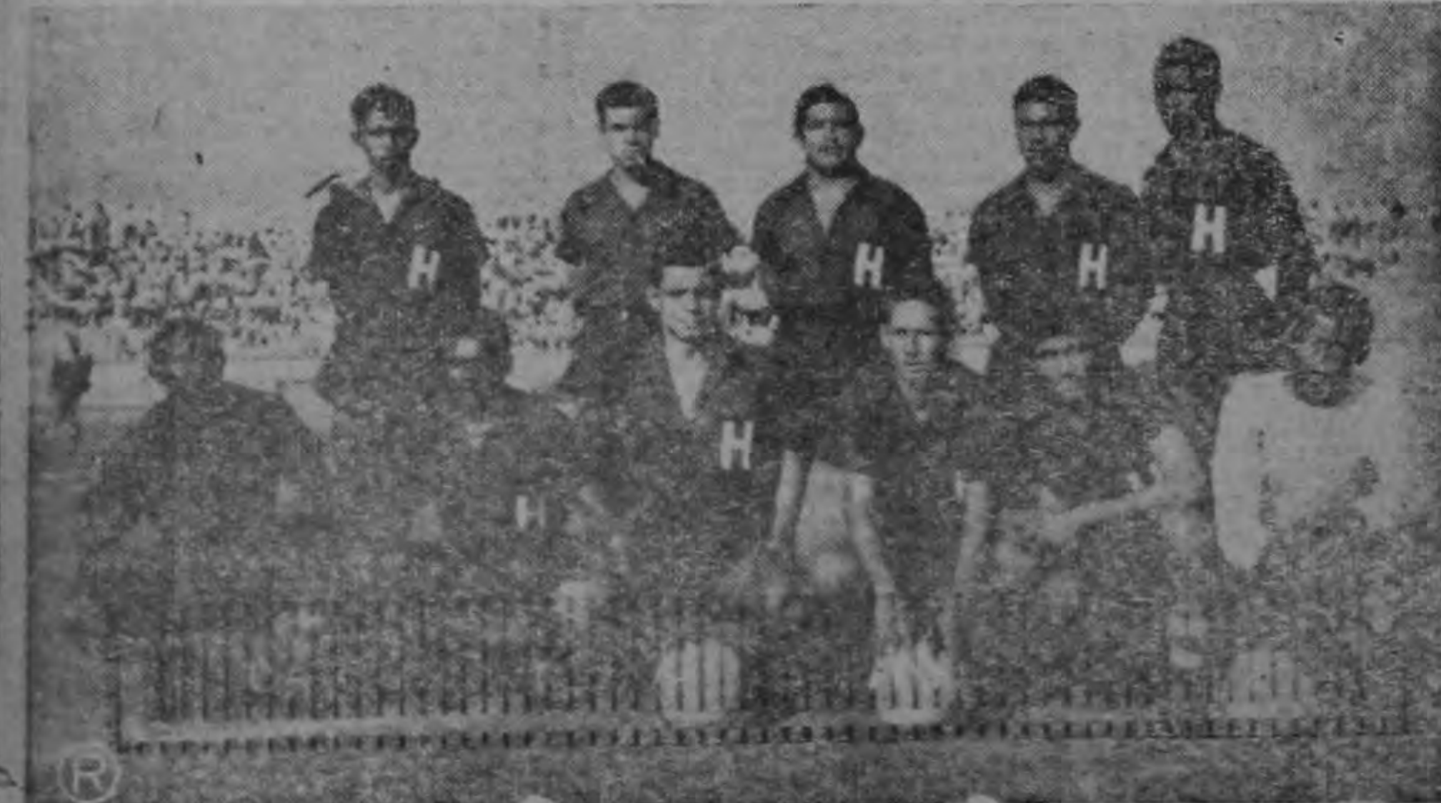
HONDURAS. — Sin chance, pero dispuesto a obtener su más caro anhelo: un "triumfo" frente a Costa Rica. ¡Para sorpresas el futbol! Pero no tanto, decimos nosotros.

Los choques de mañana en la fecha final del Séptimo Torneo de Fútbol Centro Americano y del Caribe